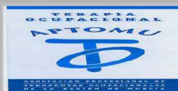
ASOCIACION PROFESIONAL DE TERAPIA OCUPACIONAL DE MURCIA