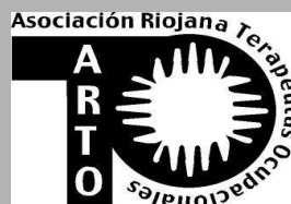
ASOCIACION PROFESIONAL DE TERAPIA OCUPACIONAL DE LA RIOJA