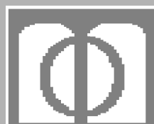
ASOCIACION PROFESIONAL DE TERAPIA OCUPACIONAL DE ANDALUCIA