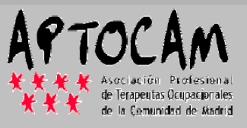
ASOCIACION PROFESIONAL DE TERAPIA OCUPACIONAL DE LA COMUNIDAD DE MADRID