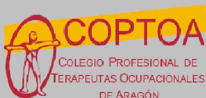
COLEGIO PROFESIONAL DE TERAPIA OCUPACIONAL DE ARAGÓN