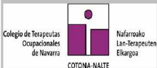
COLEGIO PROFESIONAL DE TERAPIA OCUPACIONAL DE NAVARRA