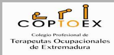
COLEGIO PROFESIONAL DE TERAPIA OCUPACIONAL DE EXTREMADURA