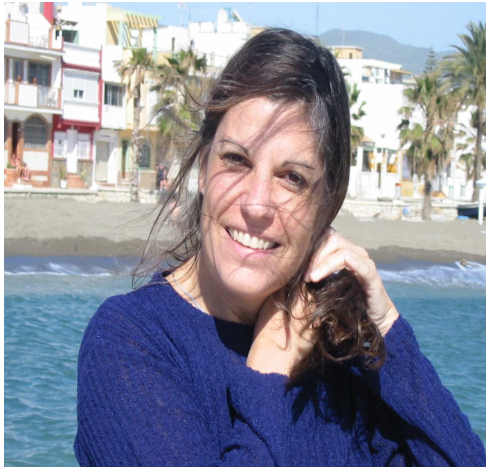
Málaga. España

compañeras de clase, a cualquier persona en la calle y a los enfermos. Tenía 10 años de edad cuando le pedí a mi mamá que me llevara con ella para acompañarle y ayudarle a realizar su labor de voluntaria de una terapeuta ocupacional que trabajaba con niños que tenían cáncer, en un Hospital pobre de Santiago. Solía ir